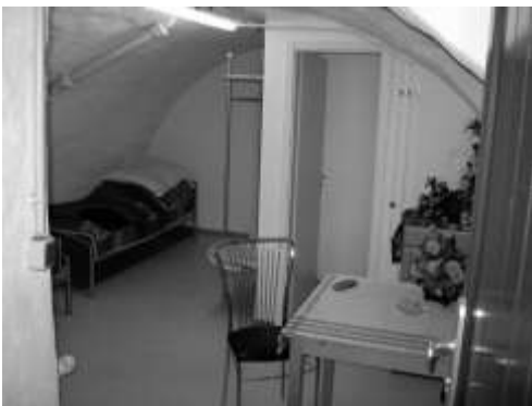
Übernachtungsraum für Frauen

Aber sogar auf die Lebenserwartung wirkt sich diese Armut aus. Im reichsten Viertel der Gesellschaft leben Männer durchschnittlich 82 Jahre, im ärmsten Viertel zehn Jahre weniger.