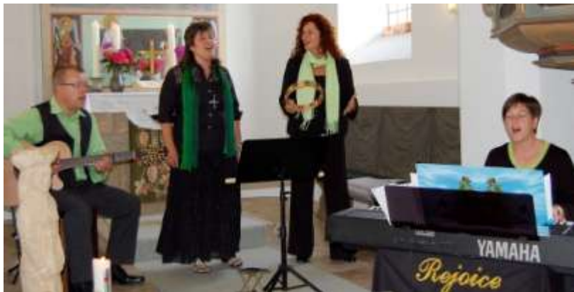
Gospelgruppe „Rejoice“ in Buch am Forst

Drei Sängerinnen und ein Sänger boten 90 Minuten mehrstimmige a-capella-Spirituals, traditionelle Gospels in begeisternden Bearbeitungen ebenso wie zeitgenössische Gospels amerikanischer Musiker und bedeu-