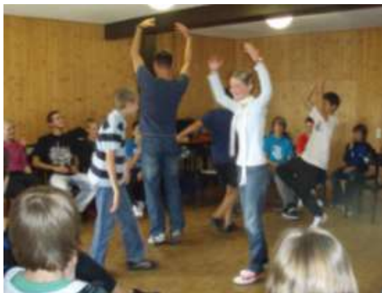
Rollenspiel: Außenseiter - Gemeinschaft

Am nächsten Tag haben wir uns über Gemeinschaft unterhalten und uns viele Gedanken darüber gemacht, wie man in einer Gemeinschaft lebt.