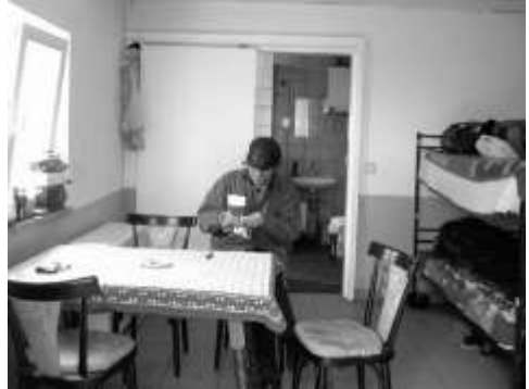
Übernachtungsraum für Männer

Die durchreisenden Wohnungslosen - im Volksmund herablassend Penner oder Landstreicher genannt - gehören zu den „relativ Armen“. Daher benötigen sie besondere Unterstützung, die sie in Miltenberg - soweit dies möglich ist - durch das Zusammenwirken von Evangelischer Gemeinde, Caritas, Stadt und Landkreis auch erhalten. Diese Unterstützung umfasst die Auszahlung des Arbeitslosengeldes II (Hartz IV) in Form von Tagessätzen, die Übernachtungsräume und den Tagesaufenthaltsraum („Wärmestube“), eine Dusche zur Körperpflege, Waschmaschine und Trockner für die Kleidung bis hin zur Beratung bei sozialen Problemen.