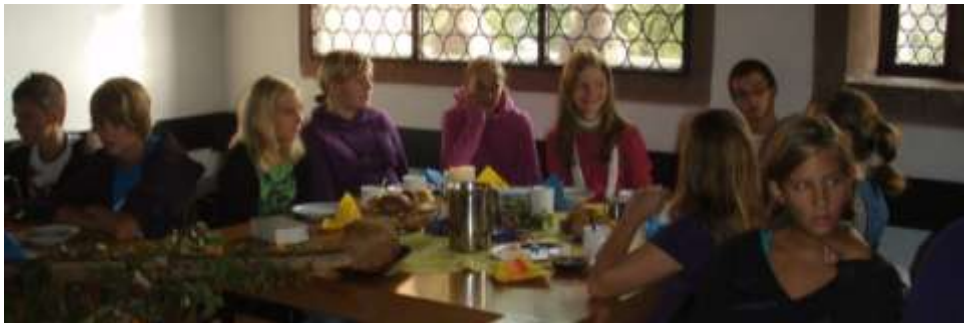
Frühstück mit Abendmahl

so nicht genug Zeit, um uns auf unseren Zimmern zu langweilen. Denn gleich am ersten Abend machten wir eine Nachtwanderung durch Rothenfels, wir konnten kaum unsere Hand vor den Augen sehen. Danach waren wir ziemlich erschöpft, deshalb war