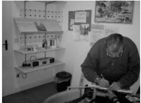
Selbst ist der Mann: ein Wohnungsloser renoviert den Aufenthaltsraum.

Gerade in der kalten Jahreszeit werden aber neben warmen Worten auch Decken, Schlafsäcke, dicke Socken und vieles mehr dringend benötigt. Dazu bedarf es kleinerer und größerer Spenden aus der ortsansässigen Bevölkerung. Möglich sind diese auf das Spendenkonto der ev. Kirchengemeinde