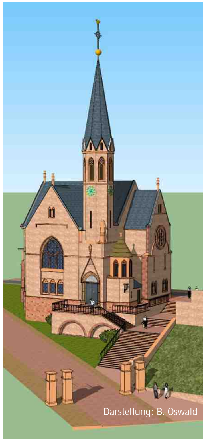
Darstellung: B. Oswald

Den Namen "Johanneskirche" erhielt sie erst 1979. Damit sollte die ökumenische Verbindung zur katholischen Pfarrkirche St. Jakobus deutlich werden, so wie Jakobus und Johannes Brüder waren.